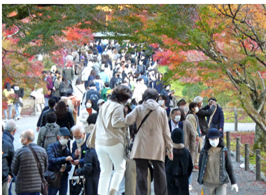
京都南禅寺も、ご覧の状況。