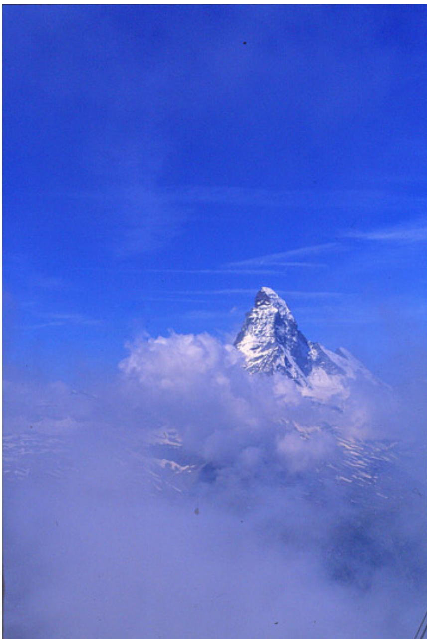
夏のスイス・マッターホルン。ある日の、ある山からの眺望。