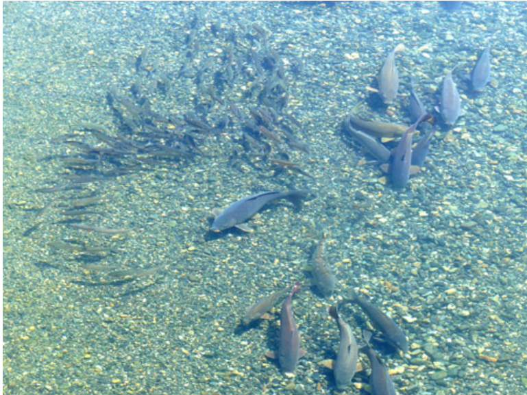
自然界との、瞬きの出会い